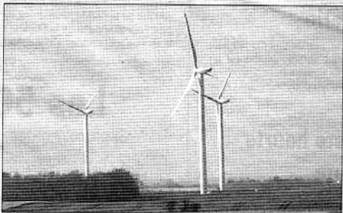
» Les projets éoliens doivent désormais satisfaire aux points de la charte, notamment en termes de bruit et de proximité des maisons.